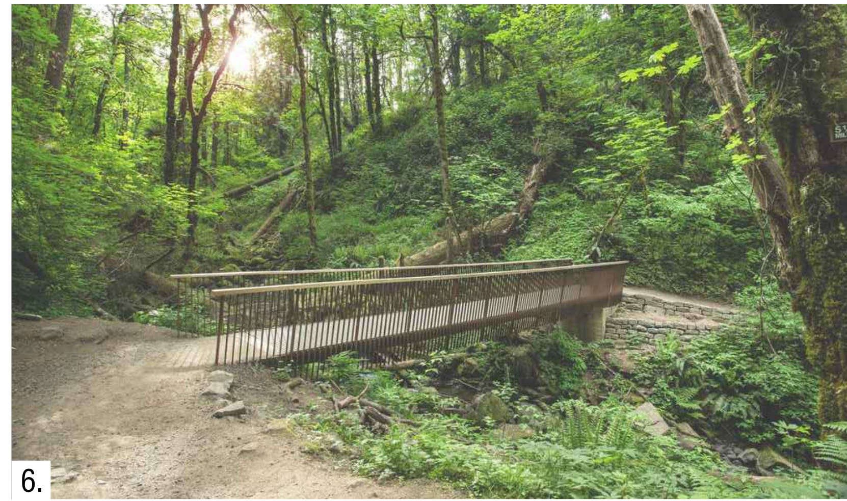
6. Inspirační podoba mostků přes potok začleněných do strmého terénu údolí v Lazečku.