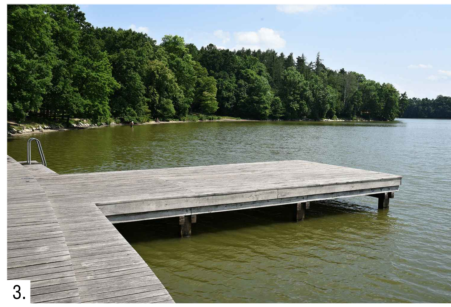
3. Inspirační podoba mola v rekreační zóně pod koupalištěm, sloužícího pro návštěvníky kavárny.