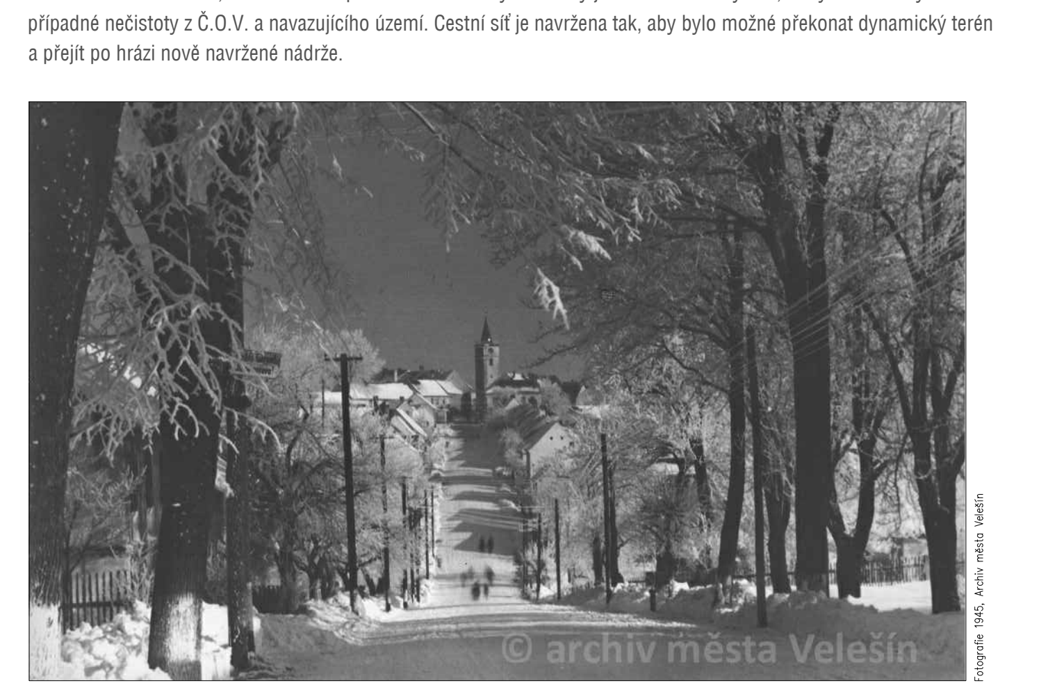
Historická aleje ulice V Domkách, rok 1945.