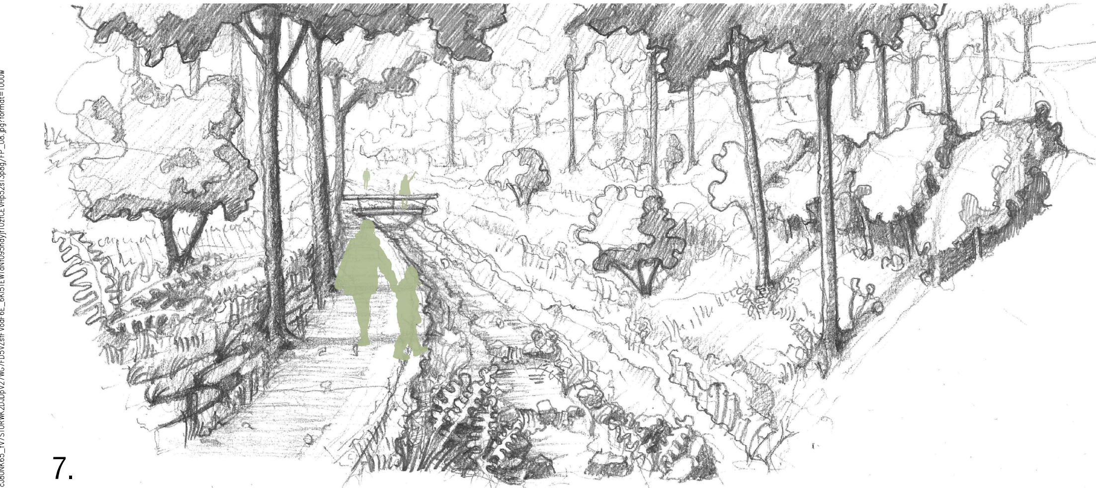
7. Skica navržených rozpracovaných porostů a revitalizovaného potoka s mostky.