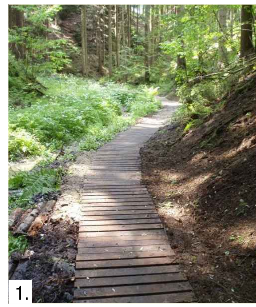
1. Inspirační podoba povalečových chodníků v podzáhmáknutých oblastech pod studánkou.