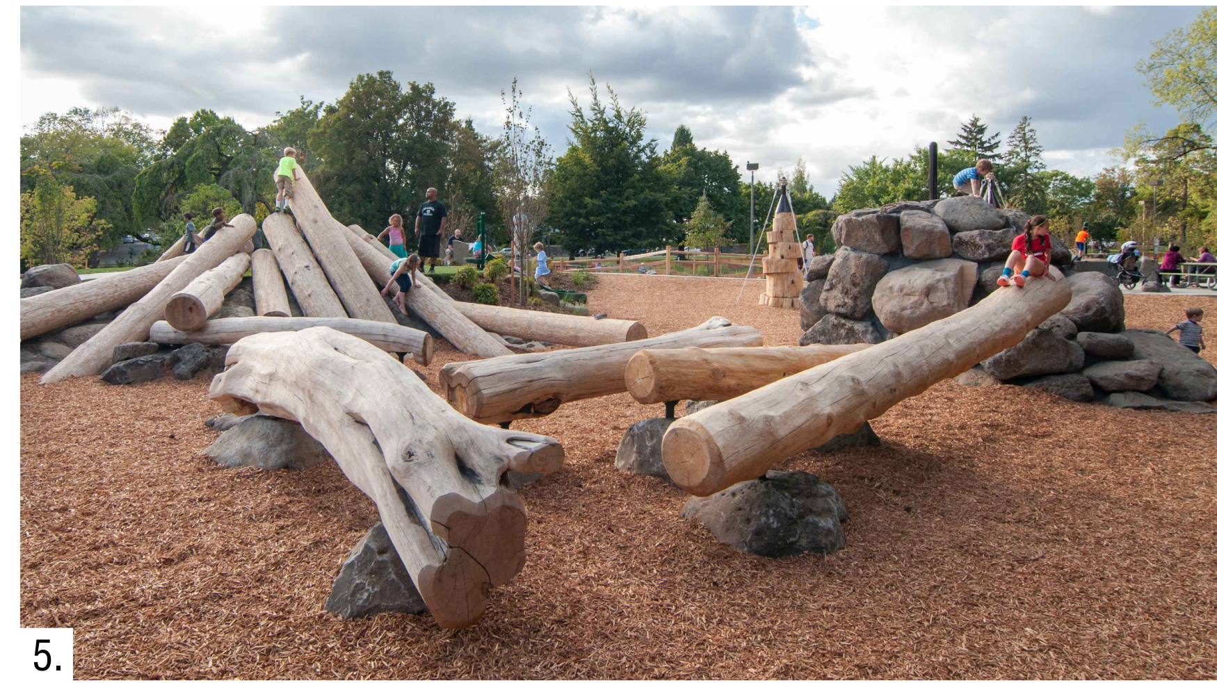
5. Navrhovaný typ přírodního nekonvenčního dětského hřiště v retenční nádrže pro zábavnější využití.