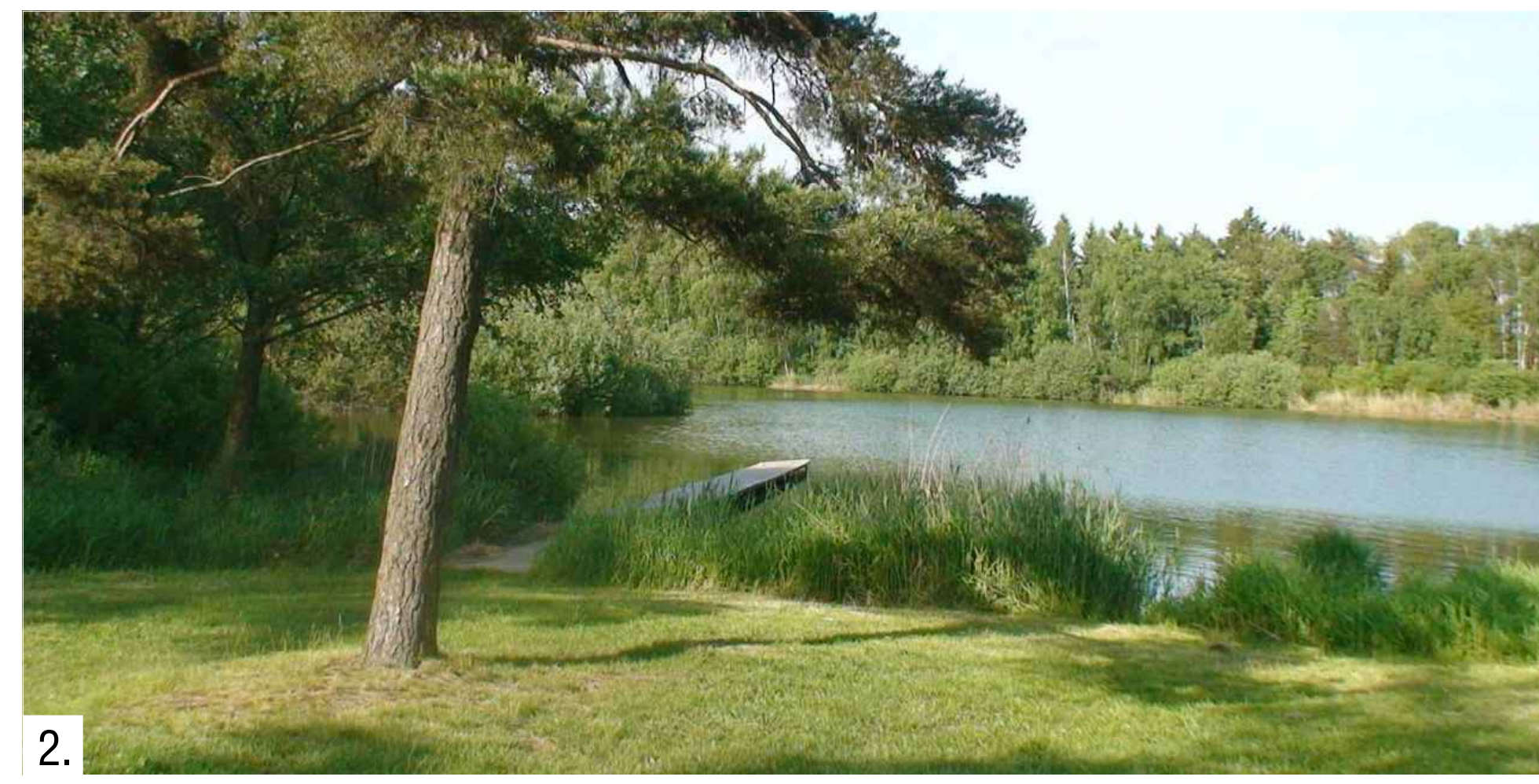
2. Inspirační podoba břehů nové navržených rybníků, které budou sloužit k pobytu a rekreaci.