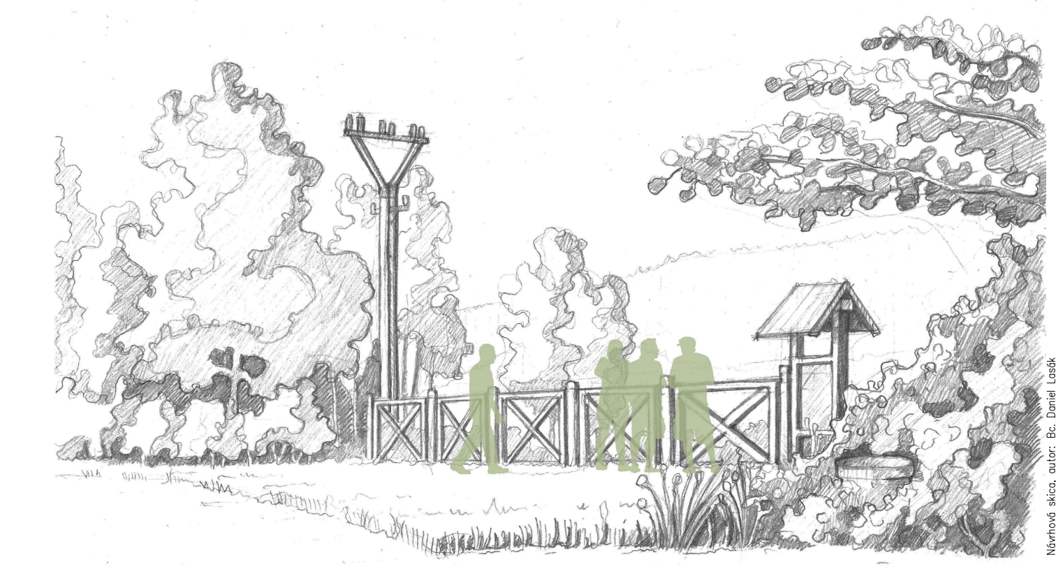
Skica navrženého prostoru vyhlídky na vodní nádrž Římov.