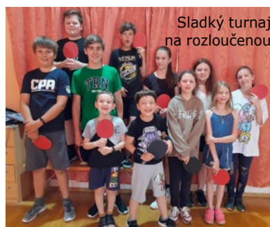
Sladký turnaj na rozloučenou

Ve čtvrtek 15.6. jsme měli tradiční Sladký turnaj na