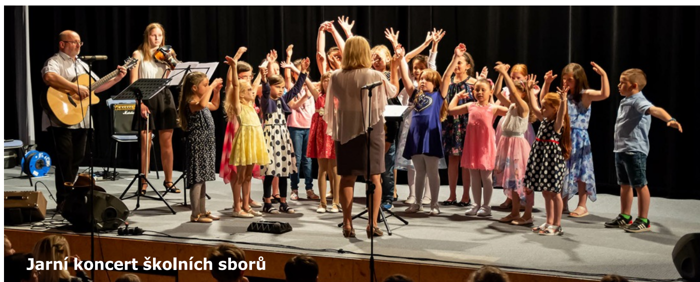
Jarní koncert školních sborů