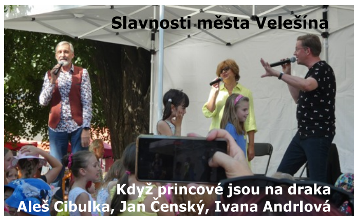
Slavnosti města Velešína