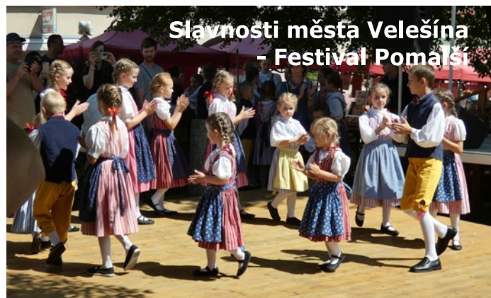
Slavnosti města Velešína - Festival Pomašiči