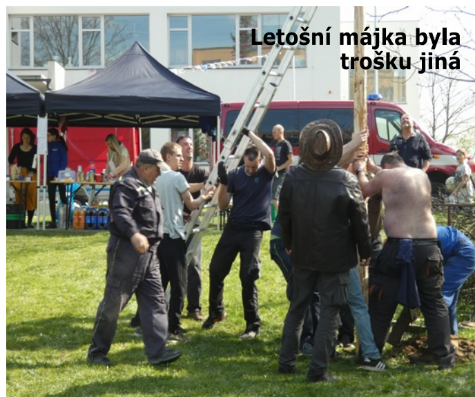
Letošní májka byla trošku jiná