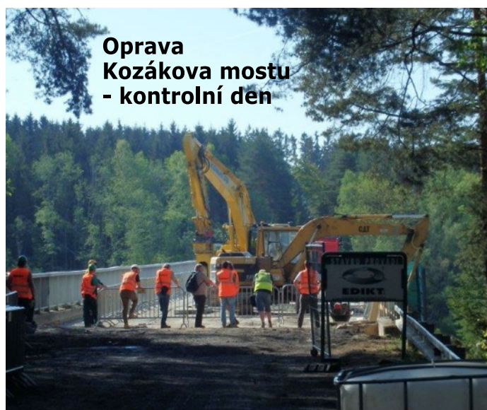
Oprava Kozákova mostu - kontrolní den