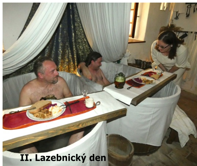
II. Lazebnický den