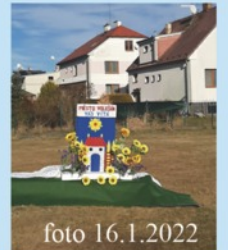
Pahorek č.2 - článek str.5