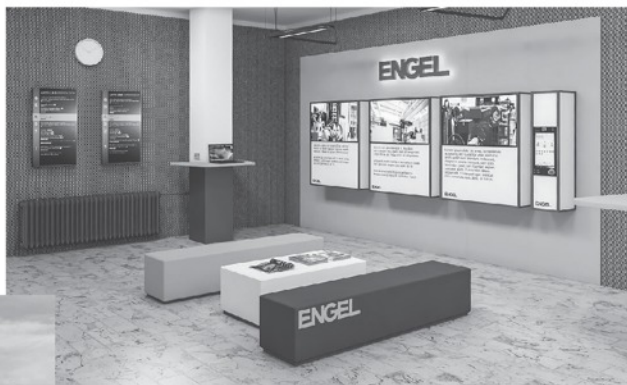
3D model zrekonstruované části auly SOŠ Velešín

Nabízíme celou řadu benefitů, odborné praxe a jiné projekty.