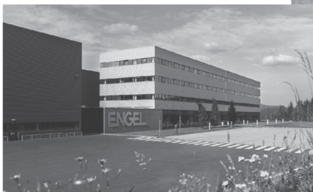
Administrativní budova kaplického ENGEL závodu