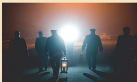
Betlémské světlo 19.12.