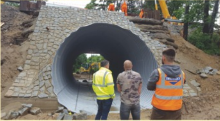
Podchod pod E55 k vlakové zastávce