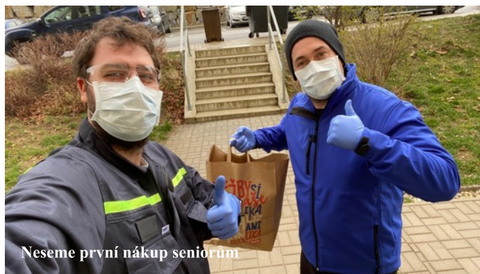
Neseme první nákup seniorům