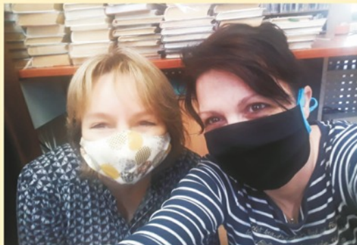
Všichni s rouškou !