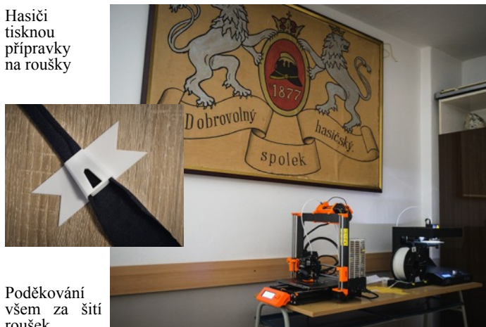
Poděkování všem za šití roušek