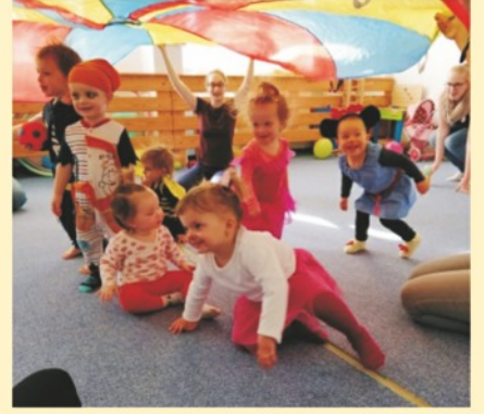
MAXPARÁDA - sál kina 3. 2. 2019