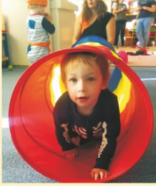
Maškarní bál v Klubičku