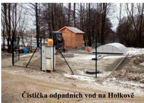
Čistička odpadních vod na Holkově