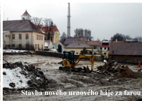
Stavba nového urnového háje za farou

natáčecích štábů nemusí televize vždy stihnout všechny zájemce o natočení reportáže.