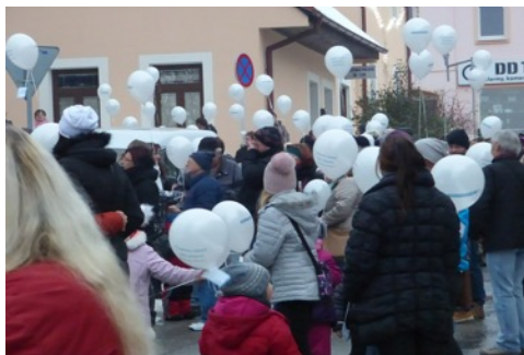
Foto: Adventní trh a rozsvícení stromu