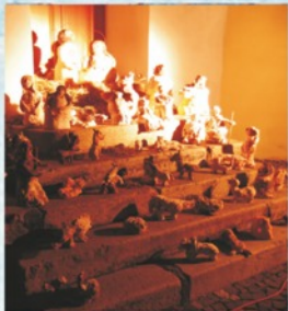
ZUŠ - betlém