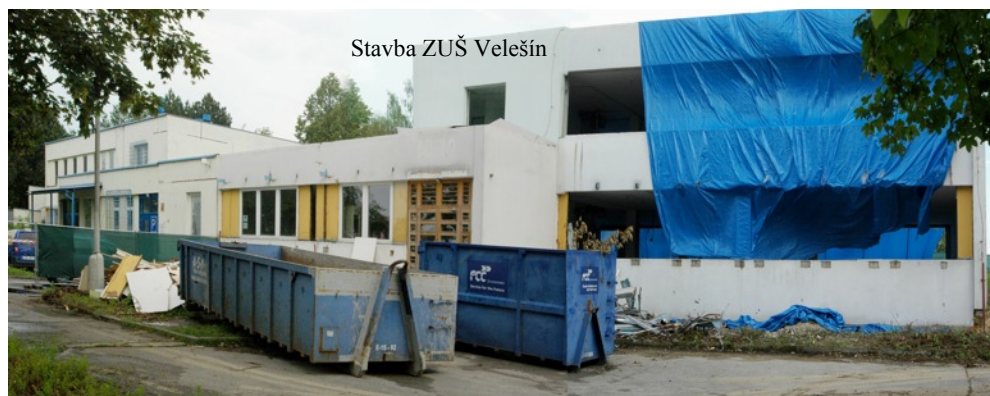
Stavba ZUŠ Velešín

Zatímco ve školách začíná poslední měsíc školního roku, uzavírá se celoroční úsilí něčemu se naučit nebo někoho něco naučit ☺, všichni se těší na prázdniny, stavební ruch ve městě však neutihá. Spíše naopak. Největší městská stavba ve městě, a to nejenom svým rozsahem, nové autobusové nádraží, ukazují svou nadzemní část, výstavba základní umělecké školy, financovaná Jihočeským krajem, zahájuje. Místní část Chodeč získává nový vodovod (financováno z městského rozpočtu), v Holkově se naopak se stavbou teprve začíná. Holkovští získají zcela novou kanalizační síť s čistírnou odpadních vod (dotace ze