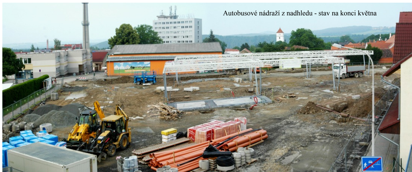
Autobusové nádraží z nadhledu - stav na konci května