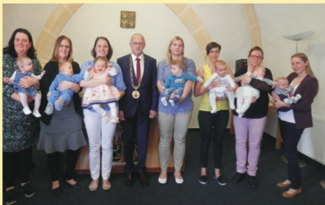
Vítání občánků - 14. dubna 2018