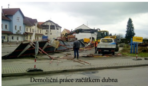
Demoliční práce začátkem dubna

na novém autobusovém nádraží, což znamená velká dopravní omezení v centru. Bohužel se ochromení průchodu a průjezdu centrem projevilo i na tržbách provozoven a těžšímu přístupu k Jihostroji. Je mi to líto, ale po dobu trvání stavby tomu nebude jinak. Stavební ruch a s tím spojené