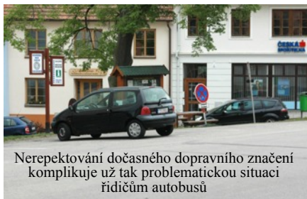
Nerepektování dočasného dopravního značení komplikuje už tak problematickou situaci řidičům autobusů