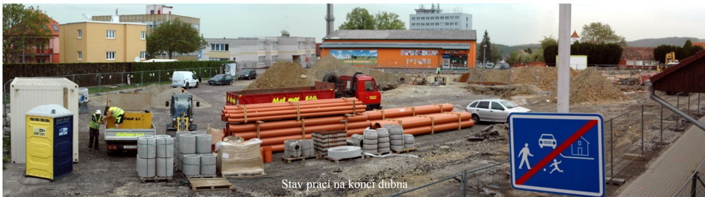
Stav prací na konci dubna