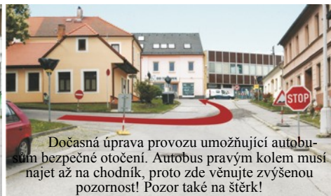
Dočasná úprava provozu umožňující autobusům bezpečné otočení. Autobus pravým kolem musí najet až na chodník, proto zde věnujte zvýšenou pozornost! Pozor také na šterky!

negativní jevy cítí i občané v Chodči (domovní přípojky k městskému vodovodu), na Holkově (zahajovaná stavba ČOV, kanalizace a rovněž vodovodu) a v dalších měsících na Nádraží (nový chodník a komunikace).