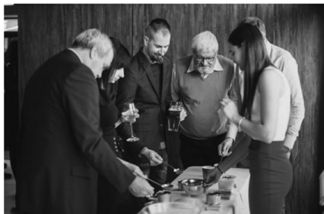
Vánoční atmosféru večíрку dokreslovalo tradiční lití olova.