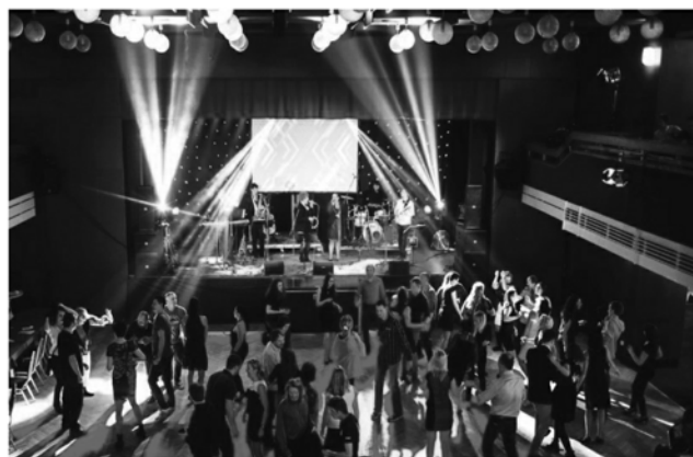
Hity kapely MP3 roztančily sál.