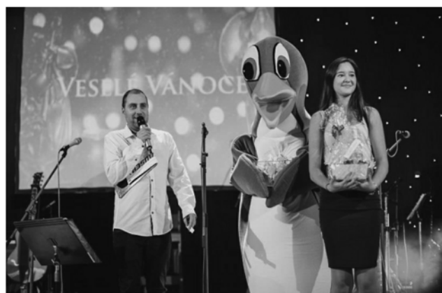
Veselý maskot v podobě tučňáka rozdával perníčky a hlavní ceny tomboly.