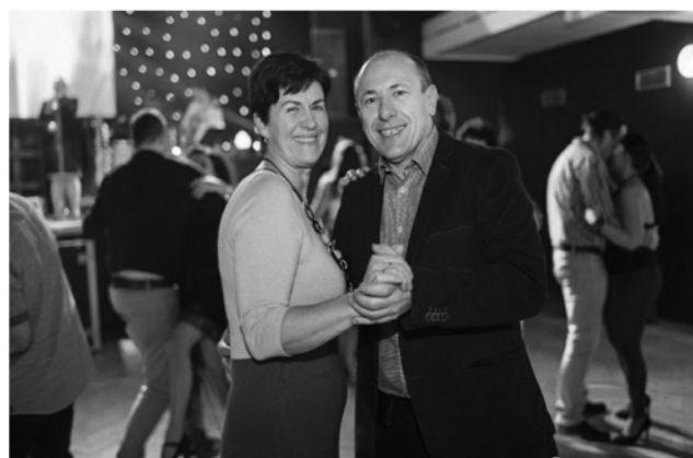
Taneční parket patřil více jak třem stovkám zaměstnanců.