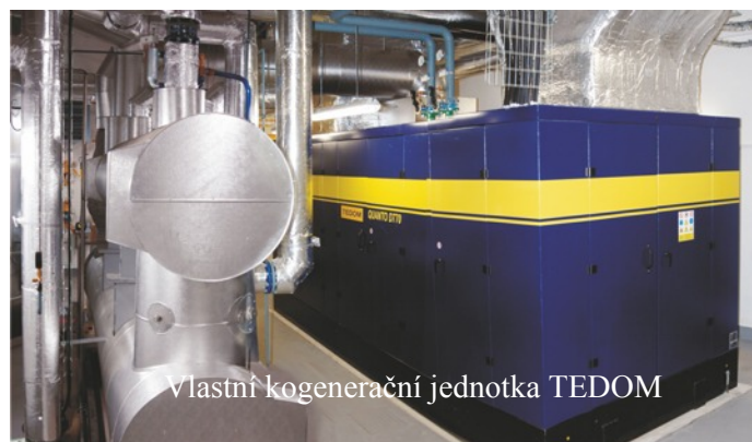
Vlastní kogenerační jednotka TEDOM