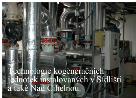
Technologie kogeneračních jednotek instalovaných v Sídlišti a také Nad Cihelnou.

Letošní paní zima zatím vládne pevnou rukou, a tak opatření, která město uskutečnilo (a má i nadále v plánu) se ukazují jako účinná. Zateplení školy, školky, bytového domu ve Strahovské ulici, nové části hasičské zbrojnice znamenalo velké úspory tepelné energie. Znatelný přínos ochraně životního prostředí, ale také úspory peněženkám uživatelům přineslo rozhodnutí pronajmout městské plynové kotelny společnosti E.ON. Ta vybudovala kogenerační jednotky, jejichž praktickým výsledkem je nákup plynu za nižší ceny, a tudíž úspora na dodávaném teple. Novinka měla sice zpočátku určité technické