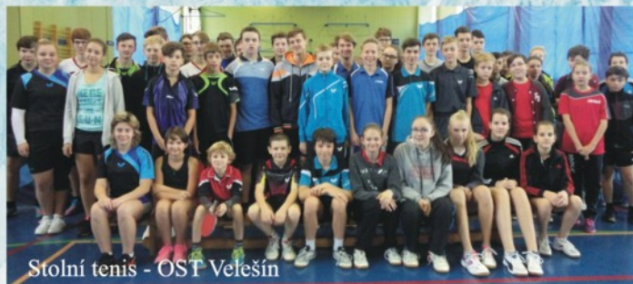
Stolní tenis - OST Velešín