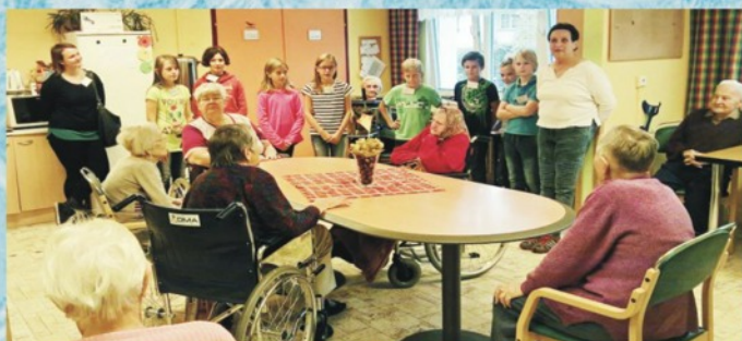
Návštěva dětí v domově pro seniory (článek na str.5)