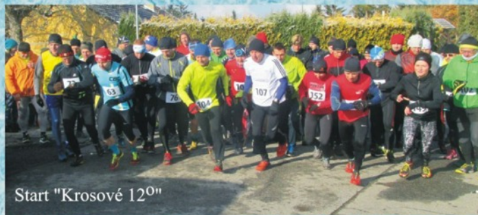
Start "Krosové 1200"

Rok s rokem se sešel a tak nám dovolte vás co nejsrdčněji pozvat na vánoční besídku Taekwon-do školy Velešín ITF.