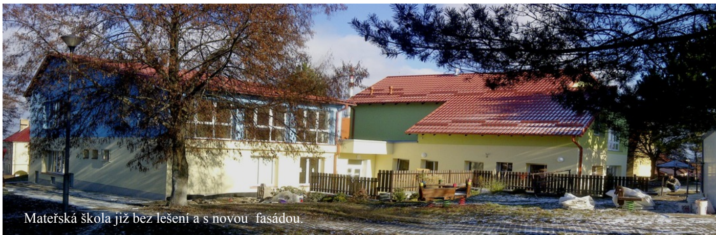
Mateřská škola již bez lešení a s novou fasádou.