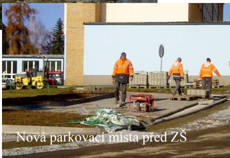
Nová parkovací místa před ZŠ

11 mil. Kč z celkově vysoutěžených 36,5 mil. Kč, když z toho 9 mil. Kč tvoří dotace ze Státního fondu rozvoje bydlení z MMR. Stavba, která je rozdělena na dvě etapy a kterou město získá 15 bytových jednotek v novostavbě a 7 dalších