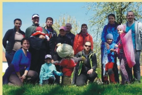
ASPV - turistický výlet