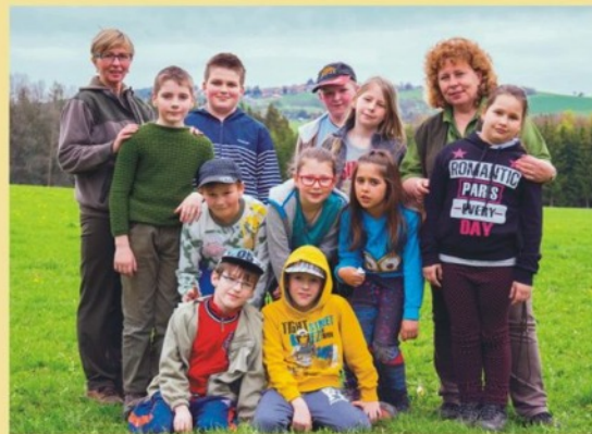
Mladí myslivci - Haluzníci