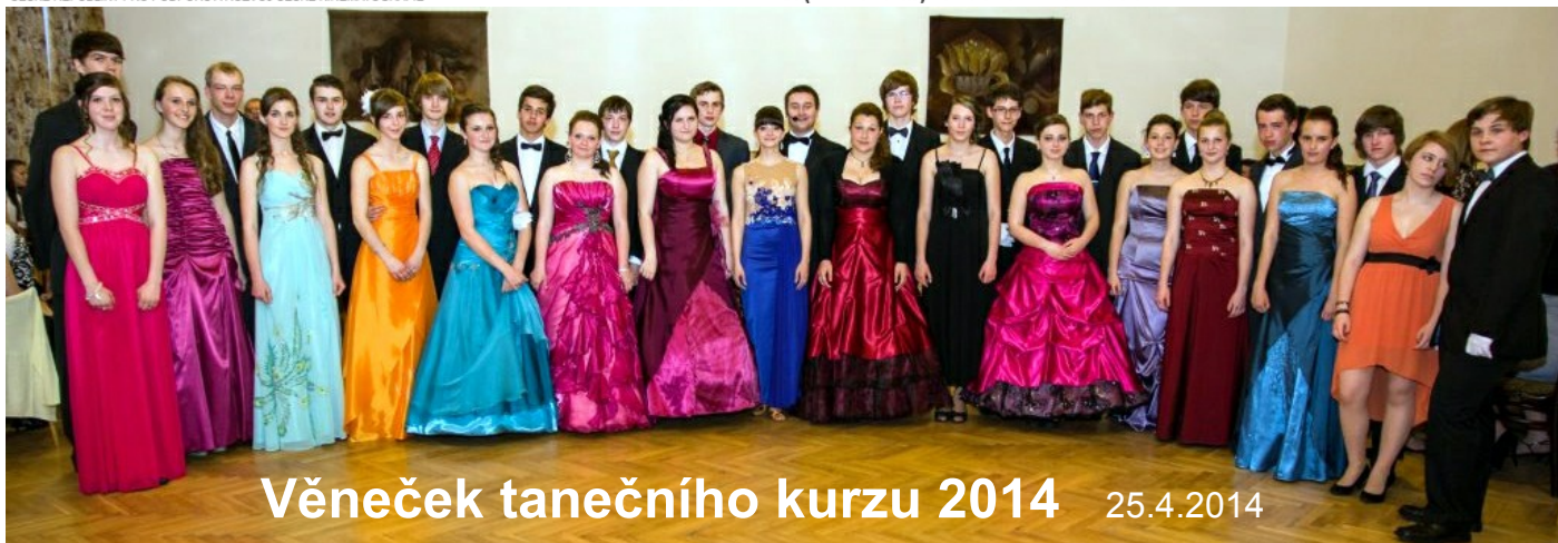
Věneček tanečního kurzu 2014 25.4.2014

ON-LINE REZERVACE: www.kinovelesin.cz, E-mail: kino@kinovelesin.cz TELEFON: 380331003 (i záznamník) NEBO OSOBNĚ V KINĚ