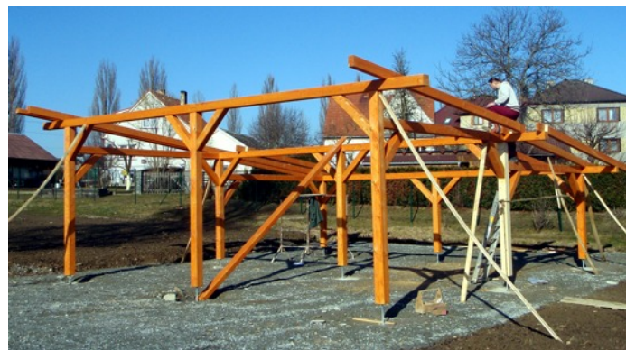
Stavba pergoly na koupališti

Čeká nás také výběrové řízení na „čisté asfalty“ Na Vrších. Tak se už snad dočkáme konce „tankodromu“.