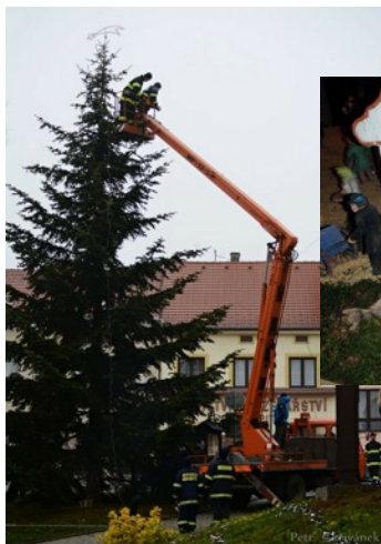
Foto - Hasiči zdobí vánoční strom na náměstí