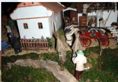
Foto - ROUHŮV BETLÉM