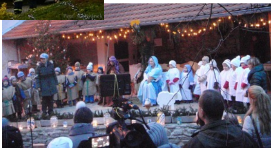
Foto - ŽIVÝ BETLÉM na Kantůrkovci