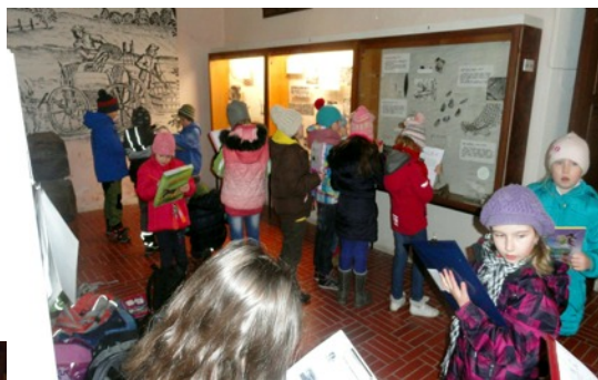
Muzeum lesnictví, rybářství a myslivosti