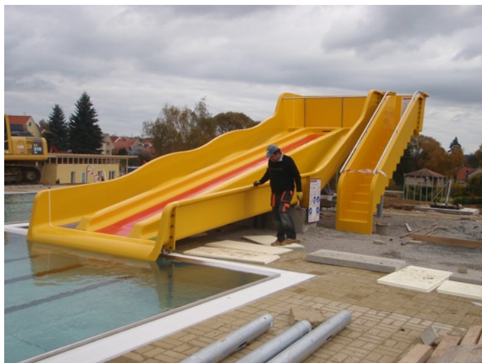
FOTO ZE STAVBY KOUPALIŠTĚ VE VELEŠÍNĚ