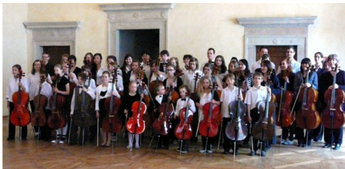
Foto z koncertu 25.5.2013 v Rytířské sále Státního hradu a zámku Jindřichův Hradec