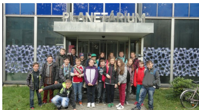
(fotografie z exkurzí)