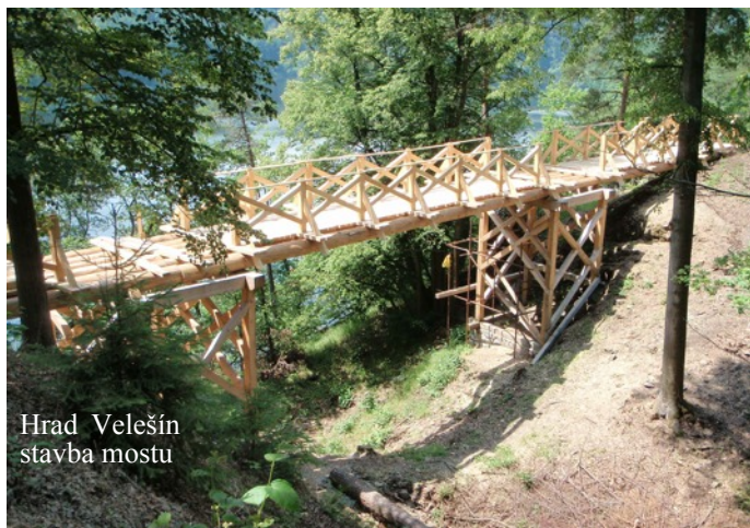
Hrad Velešín stavba mostu

Při práci se téměř denně setkáváme s úředníky příslušných městských a obecních úřadů, památkáři, konzervátory, projektanty, dotačními pracovníky a mnohými dalšími. Spolupráce není vždy jednoduchá, mnohdy jsme konfrontováni s protichůdnými požadavky, které zdánlivě nelze skloubit. Někdy jsme nuceni věc opustit a vrátit se k ní po nějakém čase. Všechny