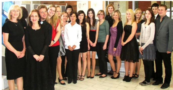
Foto: absolventi hudebních i výtvarných oborů ZUŠ 2011/2012