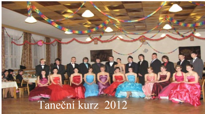
Taneční kurz 2012