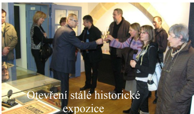
Otevření stálé historické expozice

ON-LINE REZERVACE: www.kinovelesin.cz , E-mail: kino@kinovelesin.cz TELEFON: 380331003 (i záznamník) NEBO OSOBNĚ V KINĚ