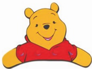
MŠ ve Velešíně