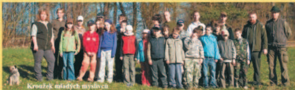
Kroužek mladých myslivců

Barevné provedení obálky tohoto zpravodaje sponzorovala uveřejněním svého inzerátu firma JIHOSTROJ a.s.