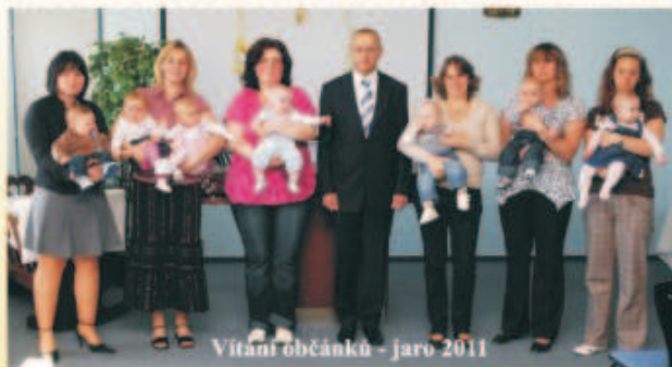
Vítání občánků – Jaro 2011