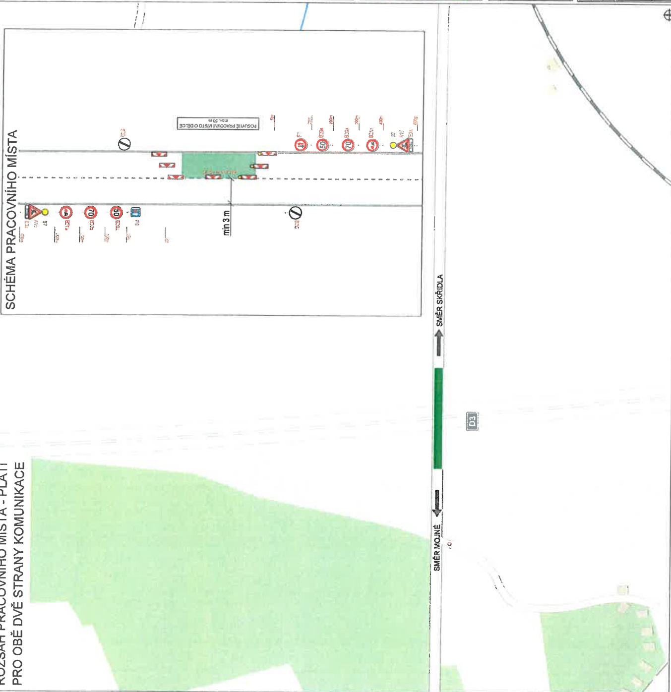
SCHÉMA PRACOVNÍHO MÍSTA

Městský úřad Kaplice Odbor dopravy a silničního hospodářství Dopravní značení schváleno (1) Č.j.: ..... Ze dne: 12. 9. 2023