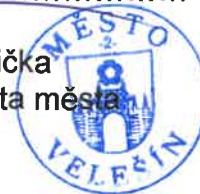
Jiří Růžička místostarosta města

Zastupitelstvo města určuje počet zastupitelů pro volební období 2022 – 2026 dle zákona č. 128/2000 Sb., zákon o obcích (obecní zřízení), ve znění pozdějších předpisů, v počtu 15 členů .